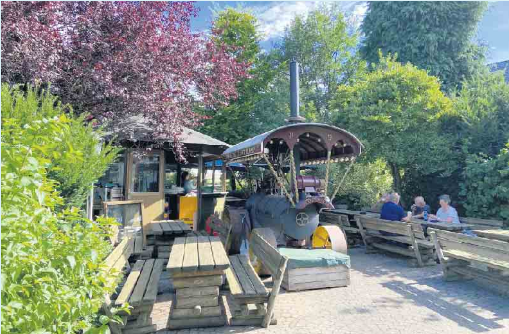
Der gemütliche Biergarten des Landgasthof Schöttes