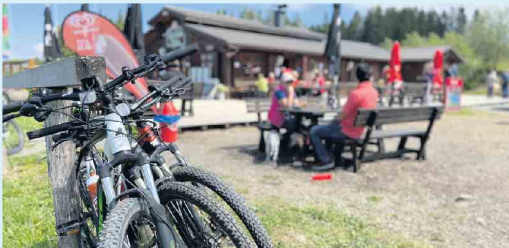
Tolle Einkehrmöglichkeit am Rothaarsteig: Die Hochheide Hütte