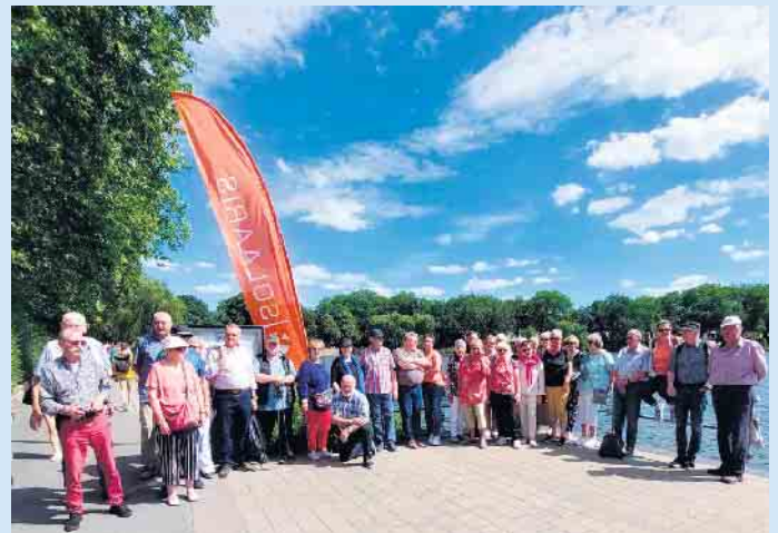
Das Foto zeigt die Reisegruppe am Aasee in Münster. Alle sind mit der Veröffentlichung einverstanden.

Abfahrt war 8 Uhr in Siedlinghausen nach einer spannenden Busreise wurde die Gruppe um 10:30 Uhr durch eine qualifizierte Gästeführerin begrüßt zu einer abwechslungsreichen Altstadtführung.