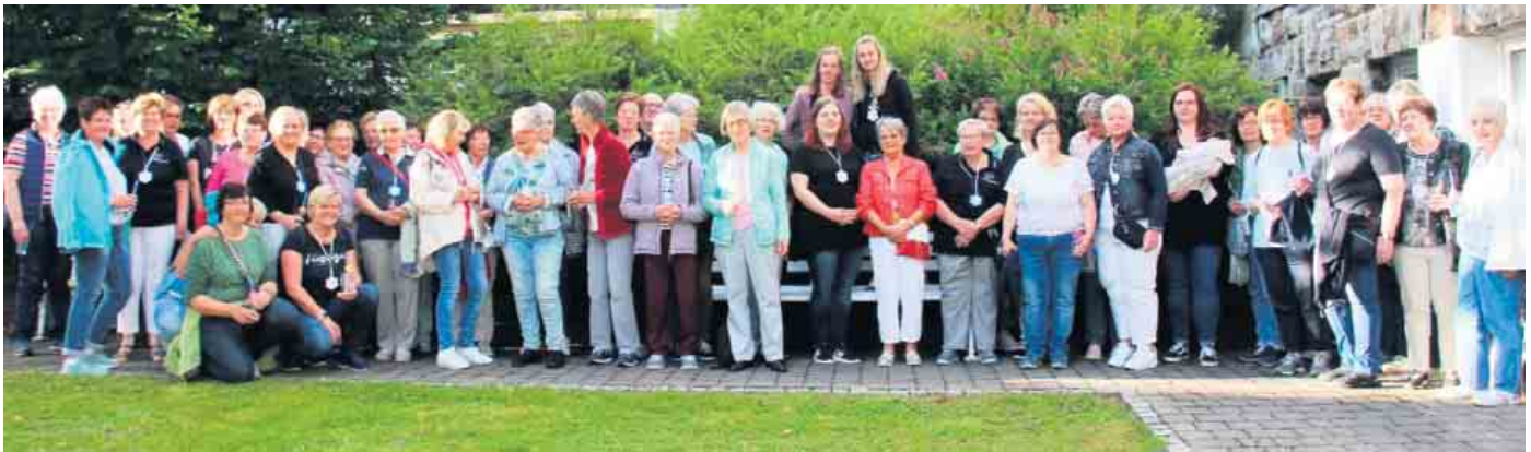
Die Teilnehmerinnen und Teilnehmer des kulinarischen Dorfrundgangs der Züscher Landfrauen.