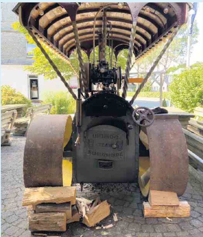
Der Barbecue-Grill im Dampflok-Style