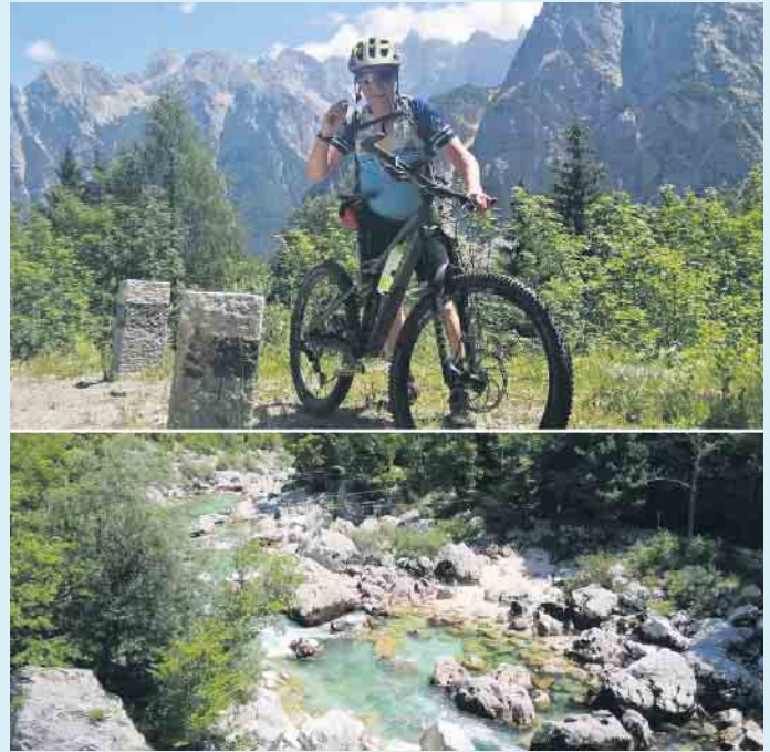
Besonders schön war es am Sojá, Europas schönstem Fluss

Truppe jubelte den Mädels und Jungs zu, die den schneid hatten, die älteren Herrschaften am Pass zu überholen. Oben bot sich nach der Bezwingung als Belohnung stets eine herrliche Aussicht über die Pässe Kranjska Gora, Vrsic' und Čepovanska. Bei der rasanten Pass-Abfahrt hatten jedoch nicht mal die Autos eine Chance! Nach der Grenzüberschreitung bei Nora Gorica in Slowenien war für alle interessant zu sehen, plötzlich in einem alten sozialistischem Land angelangt zu sein – es bot sich ein krasser, optischer Unterschied zu Italien. Als Highlight der Tour blieb die Übernachtung in einer privaten Pension mit Informationszentrum, in Trenta unterhalb der Triglav, in einer Höhe von 2464 m, allen in bleibender Erinnerung. Besonders schön war es am sprichwörtlich „schönsten Fluß Europas“, dem Sojá, mit seinem kristallklaren, türkisfarbenen Wasser und der Sicht auf viele kleine Boote. Zurück ging's mit Bus und Bahn von Triest nach Tarvisio. Teils war die Bahnstrecke gesperrt, also ging mit dem Bus weiter, wobei die Bikes kurzerhand zerlegt wurden. Die Busfahrerin zeigte Routine und über-