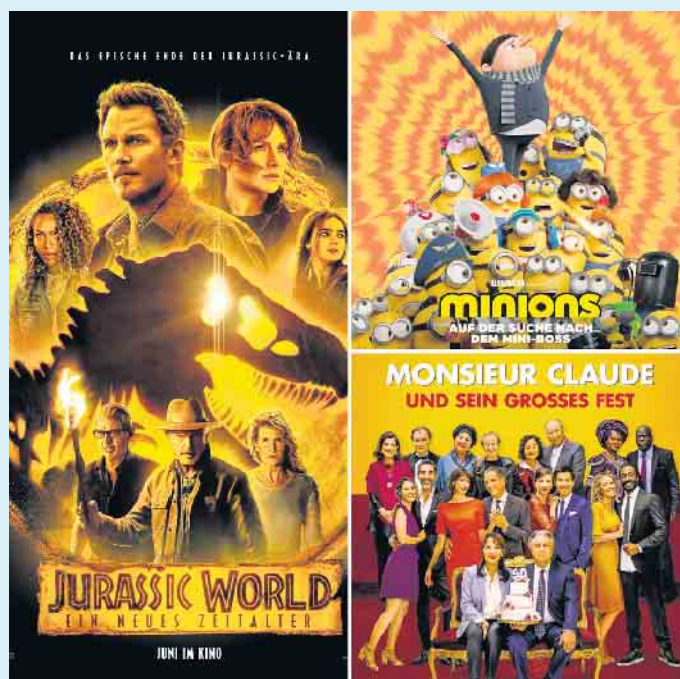
Die Filme der Open-Air-Kinoabende an der Hochheide Hütte