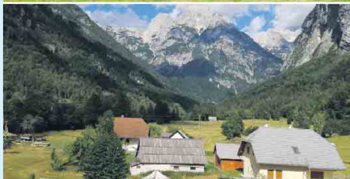
„Eine heile Welt“ bot sich den Bikern aus Winterberg bei ihrer Tour