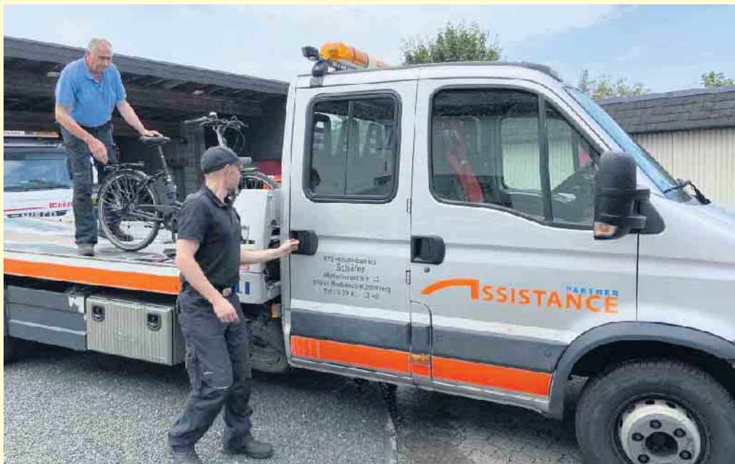
Der Kfz-Meisterbetrieb Schäfer lässt keinen im Stich- hier werden auch E-Bikes abgeschleppt