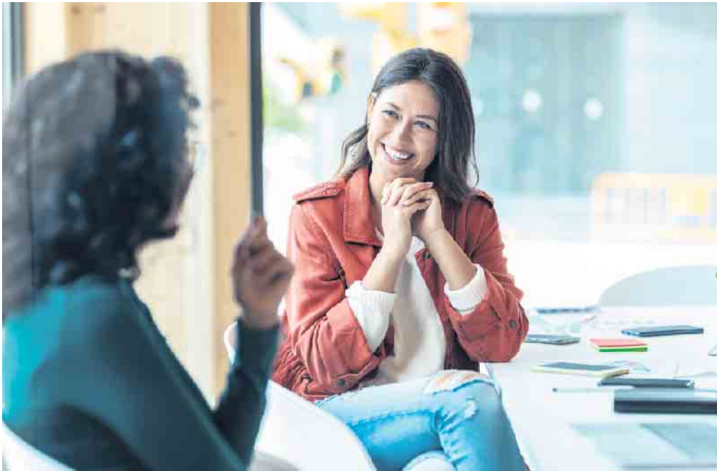
Ein Bewerbungsgespräch ist immer ein Dialog, bei dem auch der Arbeitgeber auf dem Prüfstand steht.

Geförderte Coachings helfen dabei, genau die passende Stelle zu finden