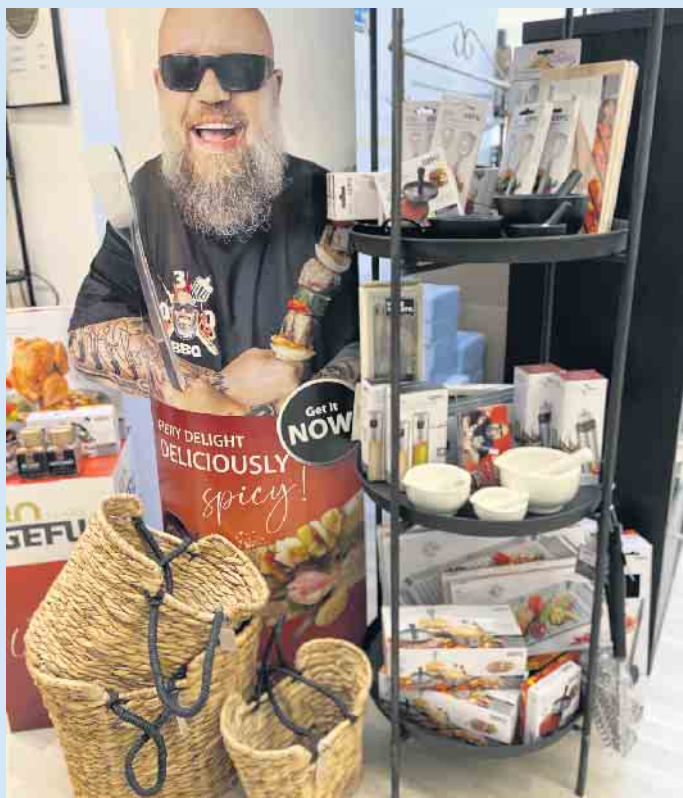
Grillausstattung von GEFU bei „Tischlein deck dich“

teren Pforte in Winterberg hat neben Grillzubehör wie Burgerpressen, Spießen, Grillpfannen in diversen Größen, Hähnchengrill, Grillzangen, Reinigungsbürsten u.v.m. die passenden Gewürze der Marke „Der kleine Gourmet“ aus Biedenkopf sowie eine weitere große Auswahl an GEFU-Artikeln rund um Pizza und Pasta. Ebenso wie Kaffee- und Espresso-Kocher, Milchaufschäumer, Wasserkocher für einen abschließenden, herrlichen Kaffeegenuss. Das Team vom „Tischlein deck dich“ aus Winterberg berät Sie gerne und wünscht „Guten Appetit“. [BL]