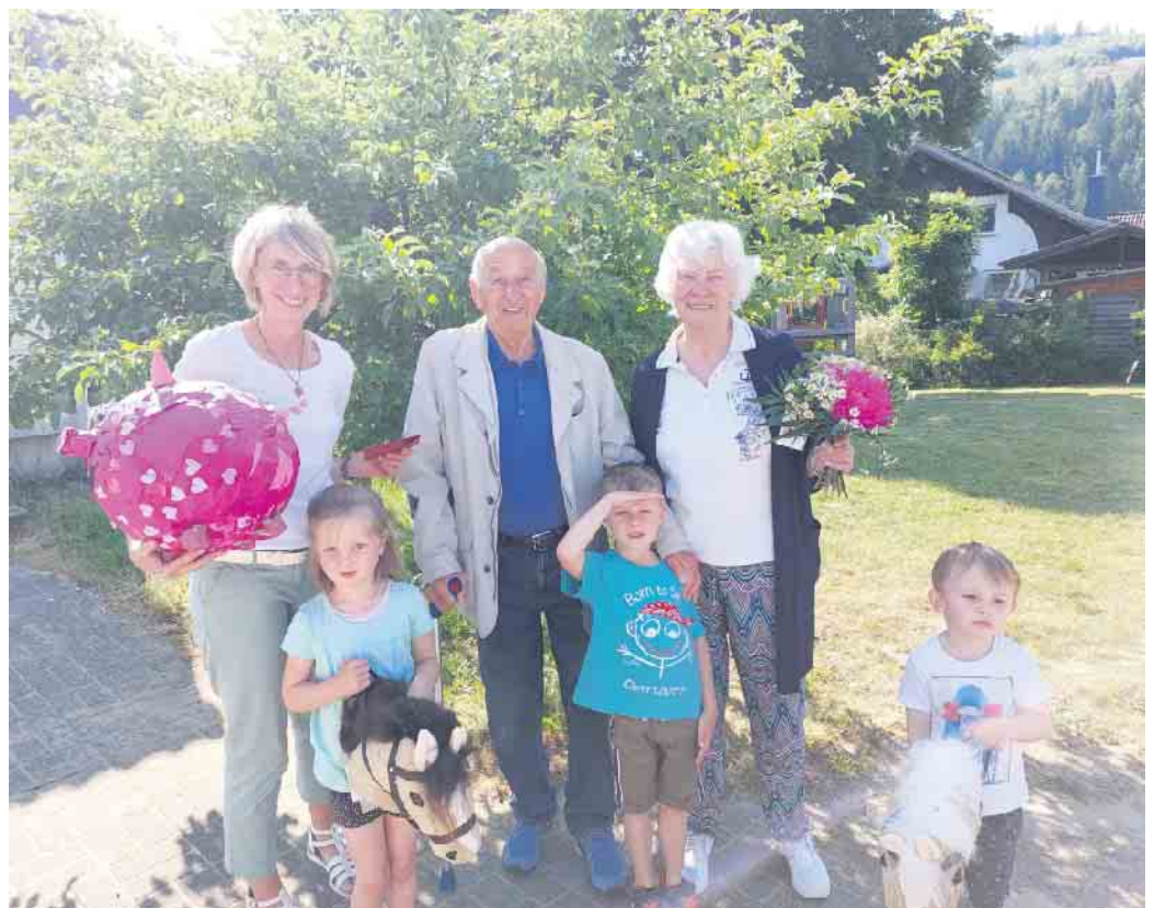
Große Freude bei der Kindertagesstätte Arche Noah in Züschen