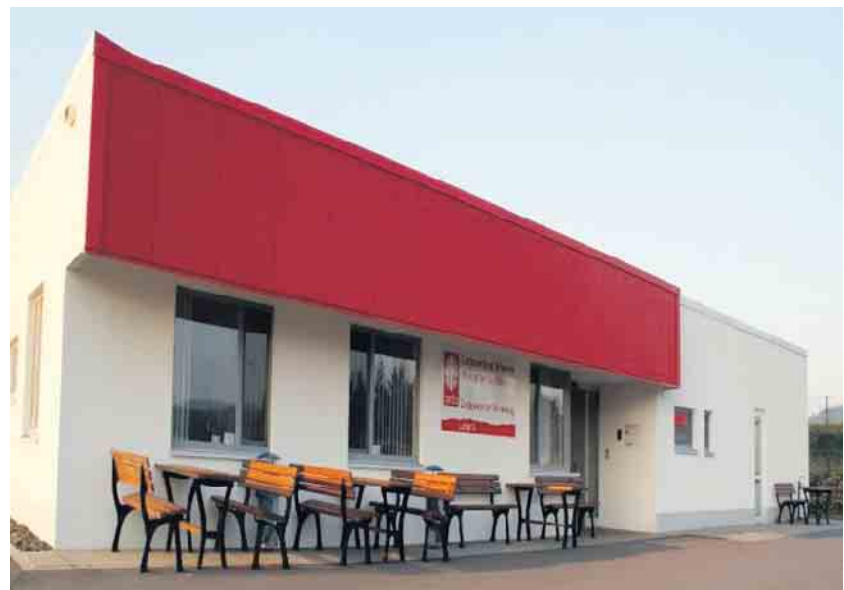
Caritas Werkstätten St. Martin feiern 10-jähriges Jubiläum der Zweigwerkstatt Winterberg.

der Caritas Zweigwerkstatt Winterberg, Lamfert 8, beginnt um 12 Uhr. Ab 12.30 Uhr werden Werkstatt-Führungen angeboten, nebst einem bunten Rahmenprogramm mit Mitmachaktionen für Kinder, Spezialitäten vom Grill sowie Kaffee und Kuchen.