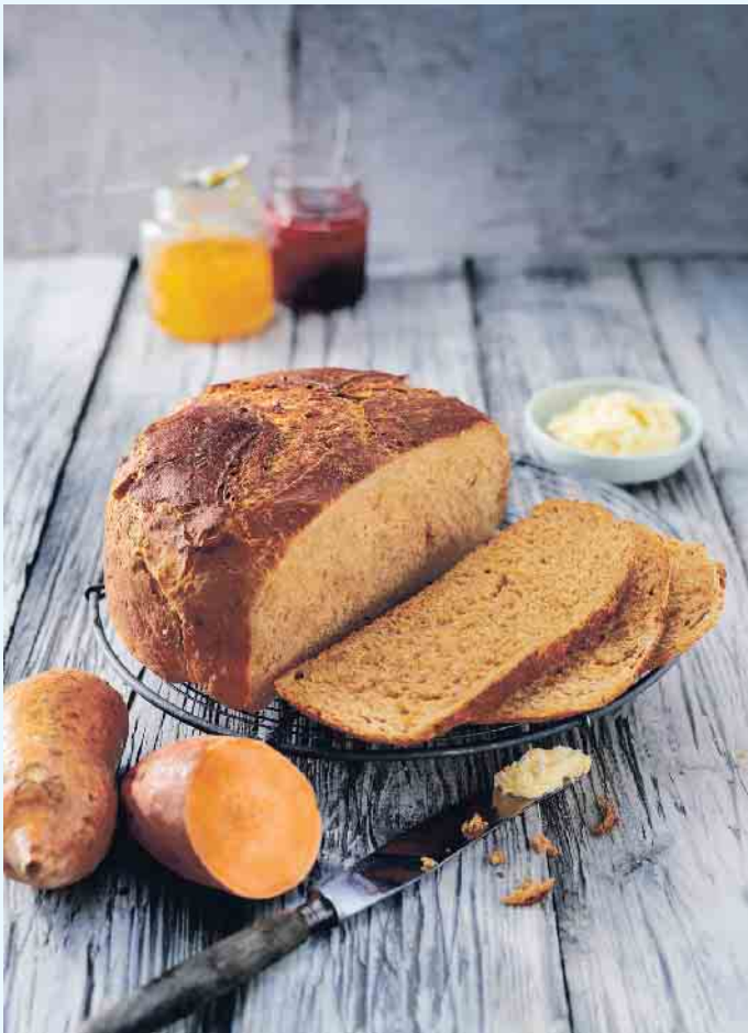
Süßkartoffel-Brot mit Walnüssen und Ahornsirup-Butter.