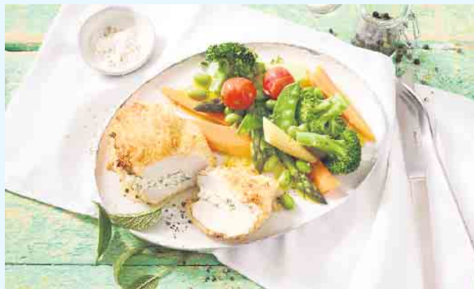
Hähnchenfilet ist leicht und enthält zudem eine Menge Eiweiß - zusammen mit einer bunten Gemüsebeilage wird es zu einem echten „Fit Food“.

Diese stehen für eine streng kontrollierte, heimische Erzeugung nach hohen Standards für den Tier-