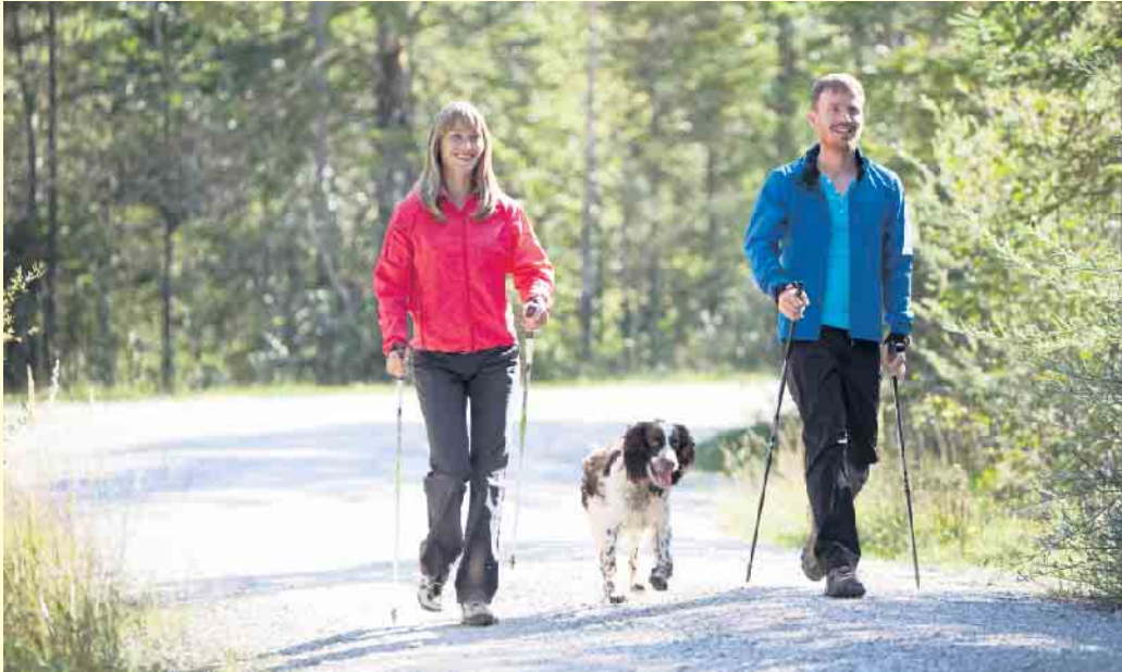
Wer sich bewegt, bleibt länger mobil. Eine für MS-Betroffene oft sehr gut geeignete Sportart ist Nordic Walking.

Körperliche Aktivität kann helfen, Beweglichkeit und Lebensfreude zu erhalten