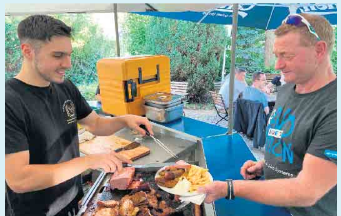
Leckeres vom Grill bei Gasthof Schöttes im Biergarten