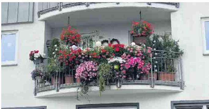
Der wohl schönste mit Blumen dekorierte Balkon, Am Waltenberg 16

gedeihenden bunten Balkonpflanzen. Trotz dem kühlen Frühjahr und dem wechselhaften Sommerwetter beweist Frau Ackermann einen echten grünen Daumen und steckt viel Liebe in ihre Blütenpracht. [BL]