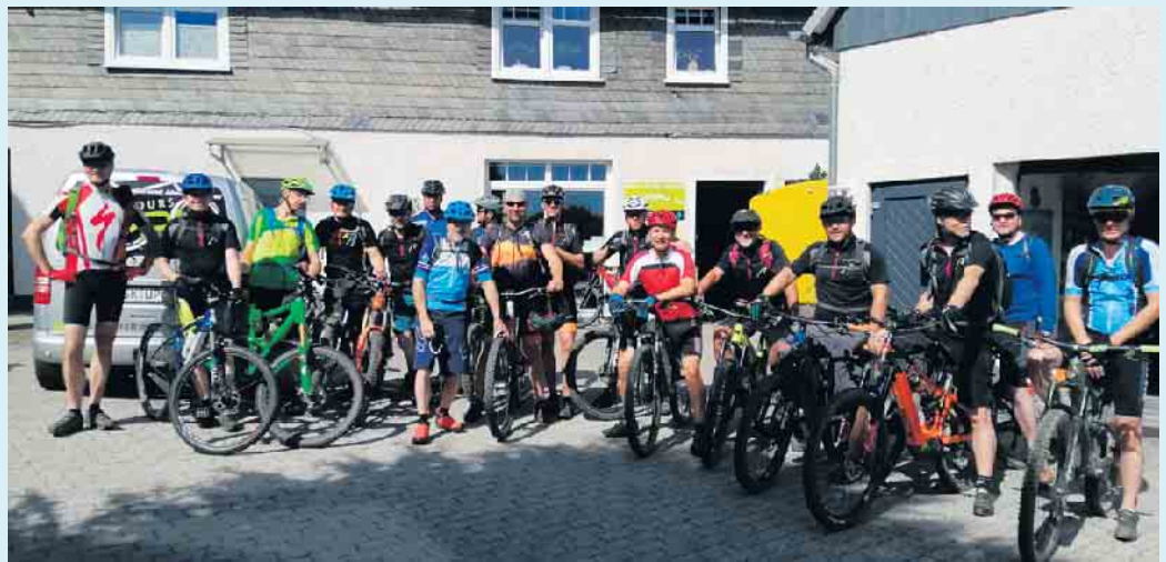
Bikegruppe an Uppu's Bikewerkstatt

Für alle Spielarten des Radfahrens von Familienausfahrten, Tourenbiken, Rennradfahren bis in die Sparte der Mountainbiker mit seinen Ablegern- Trailpark, Flowbike, Downhill und Dirtbiken ist für diese intensiven Natursportarten in dieser herrlichen Landschaft alles möglich. Bis jetzt noch uneingeschränkt. Gefahr droht nun durch die über 200 m hohen Windräder, die in den Wäldern über Züschen und Niedersfeld errichtet werden sollen. Das Erholungsgebiet von über 20 Millionen Menschen im Einzugsgebiet von zwei Stunden Autofahrt wird in seiner jetzigen Form wie wir es kennen, leider bald nicht mehr vorhanden sein. Denn wie in der tragischen Geschichte von „Don Quijote“ wurde der Kampf gegen die „Windmühlen“ verloren. Durch das neue „Wind-an-Land-Gesetz“ vom Bund können die Städte das Thema Windkraft nicht mehr selber steuern. Die Windkraft kommt nun auch bald in unsere schöne Sauerländer Landschaft und macht das Mountainbiken in den Wäldern nicht nur gefährlicher, sondern auch unattraktiver für den Tourismus, von dem unsere Region lebt. Es gibt schließlich auch einige Mountainbiker, die das ganze Jahr über ihrer schönen Sportart nachgehen, jedoch ist im Winter das Biken und Wandern in der Nähe