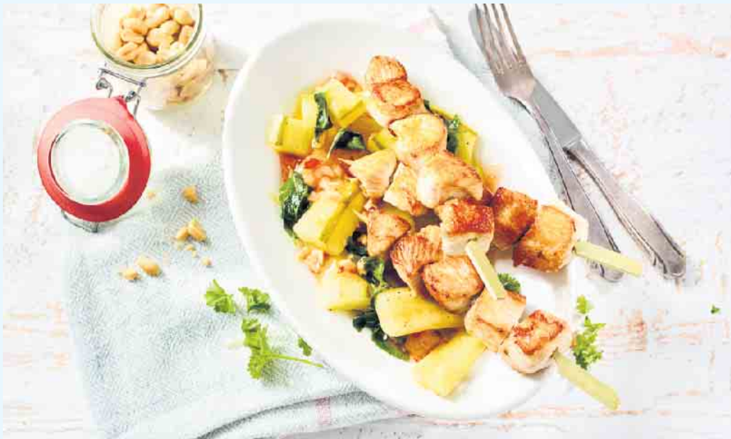
„Putenspieße mit Ingwer-Schmorgurken“ ist ein leckerer und zugleich leichter Rezepttipp. Zum Schluss wird das Ganze mit einer Handvoll Erdnüsse getoppt.