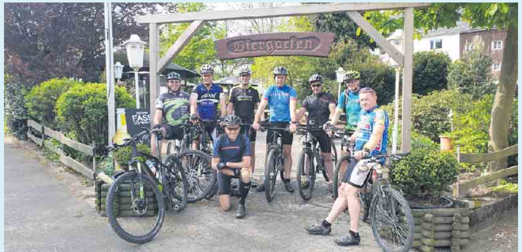
Bikegruppe vor dem Biergarten des Landgasthof Schöttes