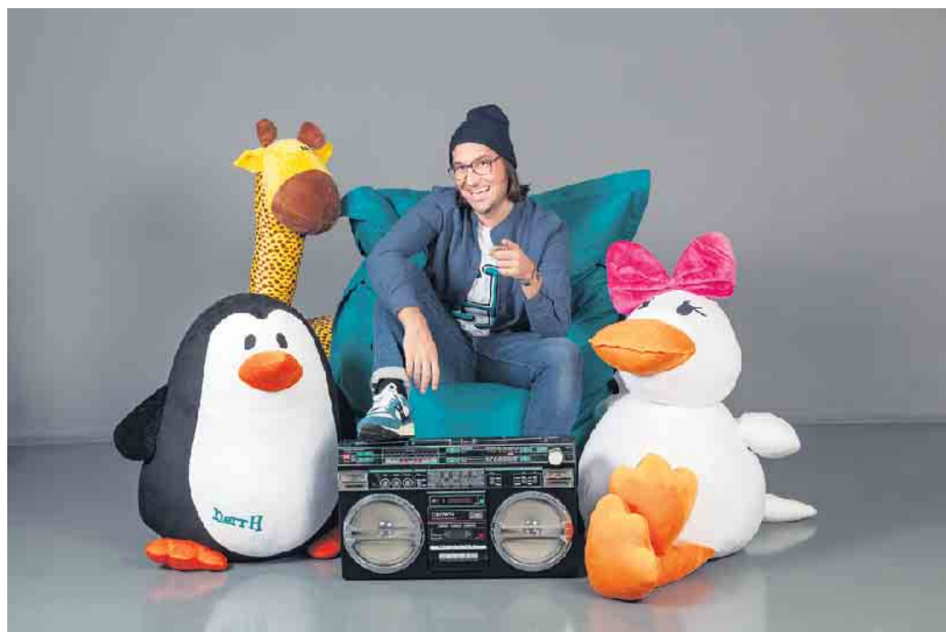
herrH gastiert am 6. August beim großen Kinderfest. Sein Mitmachkonzert an der Musikmuschel im Aktiv- und Vitalpark wird ein Highlight der Veranstaltung.

Verkaufsstände von Zeitlos, Outdoor 842 und vom Outdoorcenter Winterberg. Was fehlt? Natürlich das Angebot für die hungrigen kleinen und großen Abenteurer! „Auch dafür ist selbstverständlich gesorgt. Unter anderem bietet die Winterberger KfD Waffeln und Kaffee an. Currywurst und Pommes sowie Crêpes und ein Getränkestand dürfen definitiv nicht fehlen. Wir möchten uns schon jetzt bei allen Beteiligten bedanken, die das Kinderfest bereichern und uns großartig unterstützen. Es ist also alles angerichtet für einen großartigen Kinderfest-Tag am 6. August im Aktiv- und Vitalpark. Der Eintritt ist frei und wir freuen uns auf einen tollen Tag mit vielen kleinen und großen Gästen“, sagt Nicole Müller.