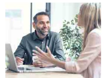
Beim Bewerbungsgespräch darf man ruhig selbstbewusst auftreten.

Zuletzt ist der Präsentationscheck für das persönliche oder gegebenenfalls auch virtuelle Bewerbungsgespräch wichtig. Für ein selbstbewusstes Auftreten ist auch hier das Vertrauen in sich selbst und die eigenen Stärken entscheidend. „Einfacher wird es zudem, wenn man sich bewusst macht, dass diese Gespräche keine Einbahnstraße sind“, erklärt GFN-Standortleiterin Michaela Ortega-Dax. „Personalverantwortliche suchen zwar nach passenden Fachkräften. Sie müssen umgekehrt aber auch jeden Bewerber und jede Bewerberin von sich als gutem Arbeitgeber überzeugen.“ (djd)