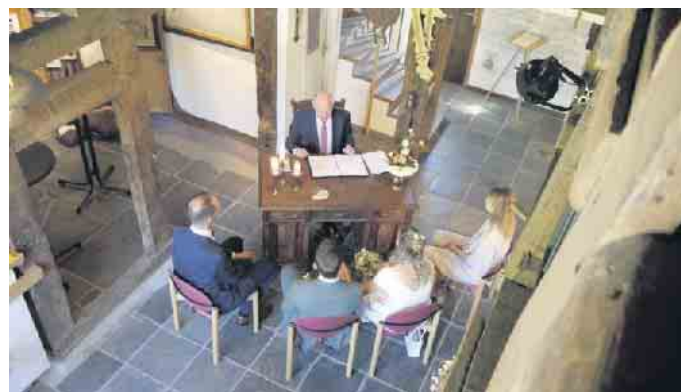
Auch in Borgs Scheune können sich Brautpaare nun das Ja-Wort geben.