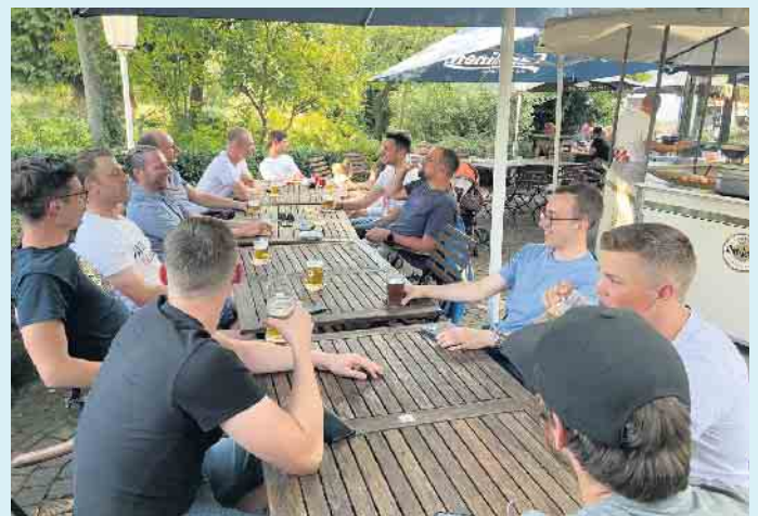
Lustige Runde im Biergarten bei Gasthof Schöttes

stellung gerne auch für zu Hause abgeholt werden. Vorbeischaun lohnt sich immer. [BL]