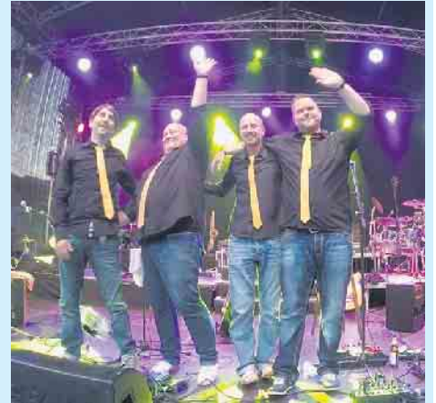
»Die Goldenen Reiter« bringen zum Festival-Auftakt die Neue Deutsche Welle ins Sauerland.

„RockaholiX“ (Rock) und zum Finale am 14. August spielt „kraftstoff“ Party, Schlager, Rock und Pop. Das bestens bewährte Konzept steht, die Bands sind gebucht, das Festival kann kommen. Sowohl Einheimische als auch Gäste dürfen sich schon jetzt darauf freuen, wieder mit guten Freunden, Arbeitskollegen oder der Familie an lauen Sommerabenden bei kühlen Getränken zusammen gute Musik zu hören und den Tag stimmungsvoll ausklingen zu lassen.