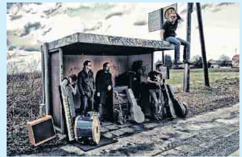
Der Name ist Programm: Am 7. August wird es rockig im Aktiv- und Vitalpark Winterberg mit der Band »RockaholiX«.

Alle Infos zur Konzert-Reihe gibt es auch im Internet unter www.winterberg.de/sparkassenopenair/