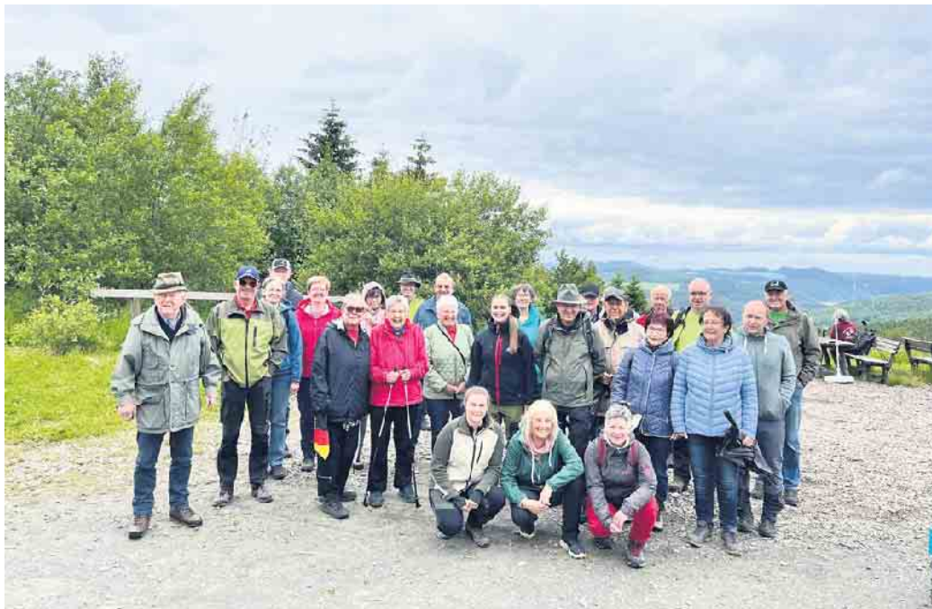
Die SGV Wandergruppe Niedersfeld gewann viele Eindrücke

SGV erkundet historische Orte auf dem Neuen Hagen