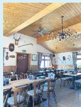
Die gemütlichen inneren Räumlichkeiten der Hochheide Hütte

der Hochheide Hütte geladen werden. Für BOSCH-Motoren sind Ladegeräte vorhanden. Seitlich an der Hütte befindet sich auch ein hochwertiges Reparatur-Kit mit diverser Werkzeug. Neben der Hütte liefert ein Getränkeautomat jederzeit zusätzlich für Wanderer und Mountainbiker Kaltgetränke „to go“. Neu seit dieser Saison sind die Pizza-Snacks in den Variationen Margerita, Salami und Schinken. Kulinarisches Highlight ist der „Pulled Pork Burger“, bestückt mit Röstzwiebeln und Gewürzgurken. Auf der Speisekarte finden sich aber auch weitere saisonale Tagesgerichte.