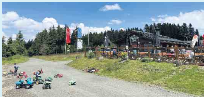
Die Hochheide Hütte mit Bobbycar-Fuhrpark für die kleinen Gäste