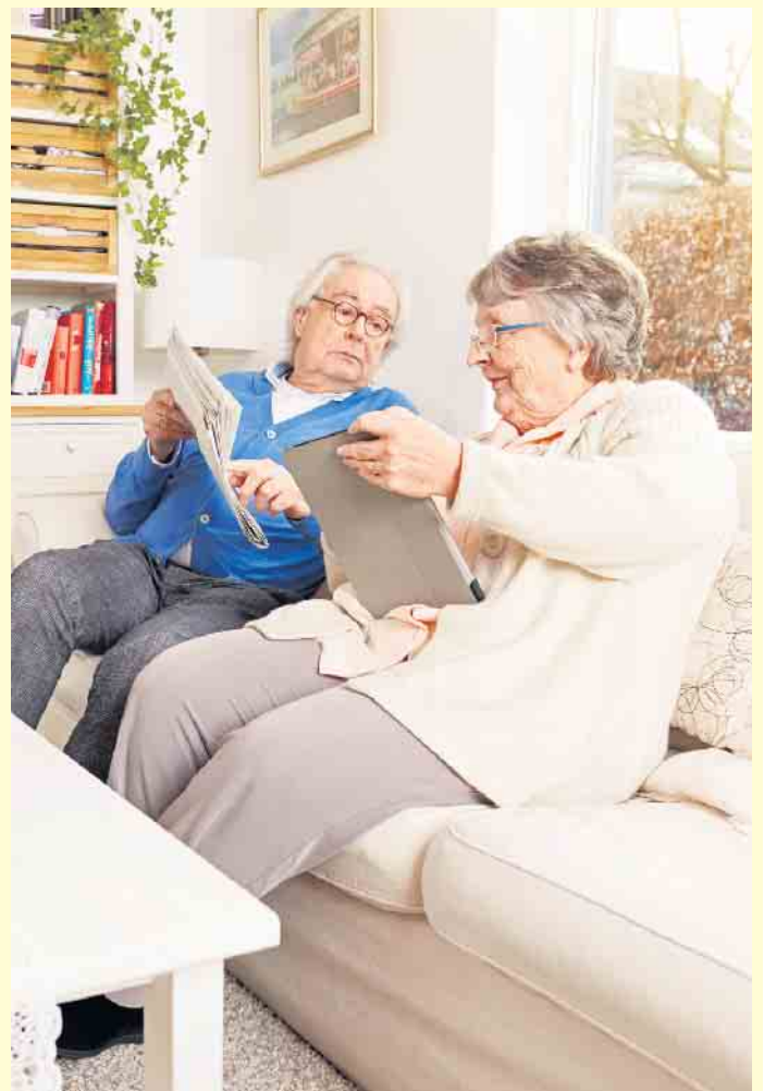
Eine Pflegeberatung hilft bei der Urlaubsplanung. Sie ist telefonisch und teilweise auch per Videogespräch möglich.

Guter Rat für entspannte Ferien Sowohl für die Vertretung verreisender Pflegepersonen als auch für den gemeinsamen Urlaub lassen sich Leistungen der Pflegeversicherung nutzen. „Wegen der vielen unterschiedlichen Möglichkeiten und Regelungen ist es aber sehr sinnvoll, für die Urlaubsplanung eine Pflegeberatung in Anspruch zu nehmen“, empfiehlt Laib. Unabhängige und kostenlose Beratung gibt es etwa telefonisch unter der compass-Service-Nummer 0800-1018800. Pflegeberatende können dabei helfen, mögliche Leistungen für den Urlaub sinnvoll zu kombinieren. Pflegegeld und Verhinderungspflege auch im Ausland nutzen „Die wichtigsten Leistungen in