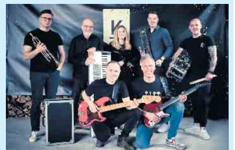
Zum Finale des „Sparkassen Open Air“-Festivals spielt „kraftstoff“ am 14. August groß auf.

Eine Woche später, am 7. August, wird „RockaholiX“ für gute Laune und Musik an der Musikmuschel sorgen. Der Name ist Programm: Die Festival-Fans dürfen sich auf Melodien aus einer Zeit freuen, in der Musik noch handgemacht, ungestaltet und schmutzig war. Von rockig geladen bis akustisch-verspielt werden Liebhaberstücke und Klassiker zu Herz und Ohr gebracht. Die fünf Musiker stehen für Klassiker der Rockge-