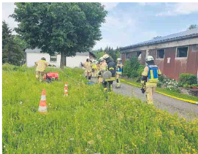
Mehrere Einheiten der Freiwilligen Feuerwehr Winterberg übten einen Ernstfall.

In der anschließenden Übungsnachbesprechung waren sich die Führungskräfte einig, dass die Übung erfolgreich verlaufen sei und einige wichtige Erkenntnisse gewonnen werden konnten.