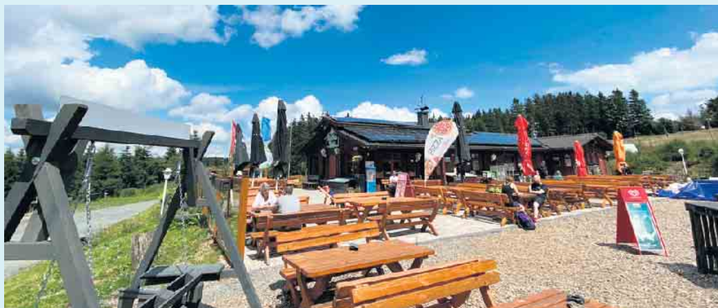
Die Hochheide Hütte in schöner Lage am Rothaarsteig

Der Gottesdienst wird in diesem Jahr ebenfalls direkt an der Hütte, ab 13.30 Uhr abgehalten. Geplant sind an diesem Tag kleine Rundfahrten mit der Pferdekutsche von der Wilkemühle aus Usseln, ebenfalls mit Start und Ankunft bei der Hochheide Hütte. Die Rollende Waldschule wird ebenfalls vor Ort sein und der Hundesportverein aus Olsberg zeigt einen Einblick in die Welt der Hunde mit Vorträgen über Hundetraining. Die Alphornbläser aus Winterberg sorgen an diesem Tag für die musikalische Unterhaltung. Bei guten Wetter wird auch eine Hüpfburg für die kleinen Gäste aufgestellt.