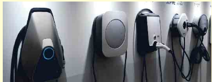
Für Autofahrer ist das Ladeangebot noch recht unübersichtlich.

quent vorangetrieben werden. E-Mobilität dürfe nicht nur für Besitzer eines Eigenheims alltags-tauglich und erschwinglich sein. Insbesondere Mieter bräuchten Lösungen, um unkompliziert laden zu können. (mid/ak-o)