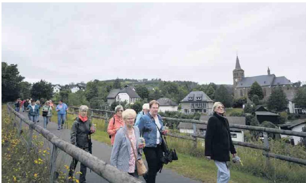
Fast 50 Teilnehmerinnen nahmen an dem kulinarischem Dorfrundgang teil.

Neben den üblichen Fleischspezialitäten gab es aber auch Gemüsespieße und Hickelkartoffeln aus der Pfanne, verschiedene gegrillte Käsesorten, Brokkolisalat, Kräuterbutter, Spinattaler, gegrillte Ananas oder frisches Brot mit verschiedenen Dips, es blieben keine Wünsche offen. Nach dem Erdbeertraum und dem Pfirsich Tiramisu waren sich aber alle Teilnehmerinnen einig, wir sehen uns im nächsten Jahr wieder.