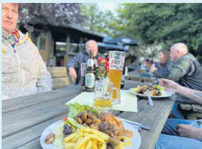
Leckeres Grillbuffet im Biergarten vom Gasthof Schöttes

des. Nach einer langen Biketour kann man im Biergarten mit Rondell direkt neben dem Gasthof bei gutem Wetter den Tag in gemütlicher Runde ausklingen lassen. Bei schlechtem Wetter natürlich auch in der Wirtsstube. Alle Speisen können einen Tag zuvor auf Bestellung gerne auch für zu Hause abgeholt werden. Vorbeischaun lohnt sich immer. [BL]