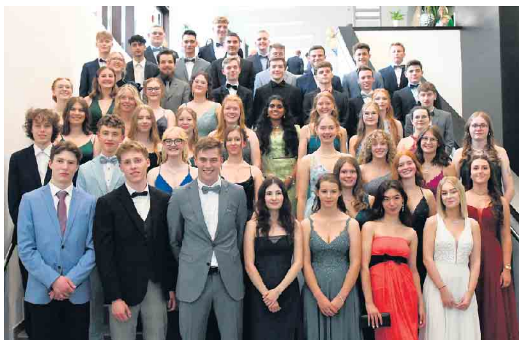
51 Schülerinnen und Schüler bekamen feierlich ihr Abiturzeugnis übergeben.