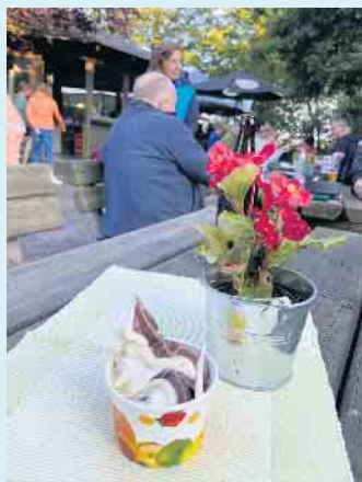
Neues, leckeres Softeis im Biergarten beim Gasthof Schöttes

Sommertage zaubert die neue Eismaschine leckeres Softeis in den Geschmacksvarianten Vanille, Erdbeer und Schoko. Viele Rennrad- und Mountainbike-Gruppen, aber auch Motorradfahrer kehren schon seit vielen Jahren hier ein und kommen immer wieder. Besonders die Mountainbiker und Rennradgruppen sind hier herzlich willkommen.- Alles entstand vor Jahren, als der aus den Niederlanden stammende „Ben“ Urlaub im Sauerland machte und zwar im Nachbarort Assinghausen. Auf der Suche nach einem