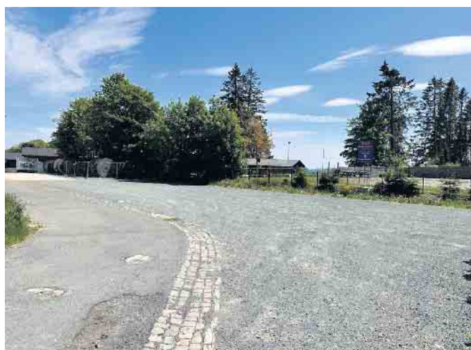
Auf der Fläche neben den Tennisplätzen in Winterberg im Fichtenweg sollen 24 Wohneinheiten entstehen