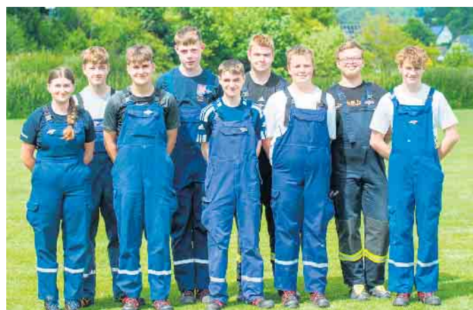
9 Kameradinnen und Kameraden der Einheit Züschen nahmen an der Leistungsspange teil.

Ein besonderer Dank gilt den Mitgliedern, die aufgrund ihres jungen Alters zwar an der Veranstaltung teilnehmen konnten, aber die Spange noch nicht verliehen bekommen haben.